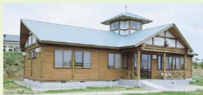
木造の自然体験学習施設 B-2