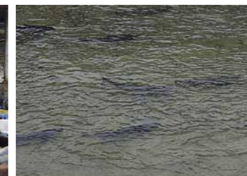
近くには漁港もあるからのぞいてみてください